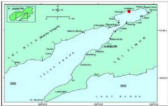
Gambar 1. Peta Lokasi Penelitian pada Hutan Mangrove Pantai Waiheru - Teluk Ambon Dalam

Penelitian ini dilalsanakan pada bulan desember 2015 sampai Januari 2016 pada kawasan mangrove Waiheru Teluk Ambon Dalam. Lokasi penelitian ditentukan secara purposive dengan pertimbangan letak ekosistem hutan mangrove sebagai stasiun pengamatan yang berada di Teluk Ambon Dalam (Gambar 1). Terlatak pada Posisi 3°38'2.09" LS - 128°12'59.02" BT.